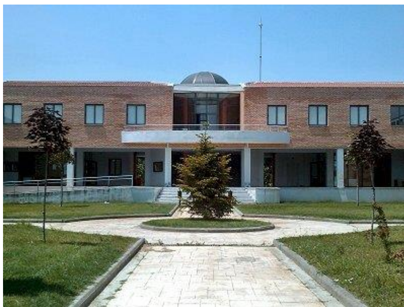
Εικόνα 1. Όψη του κτιρίου του Τμήματος Μηχανικών Πληροφορικής, Υπολογιστών και Τηλεπικοινωνιών

Η φιλοσοφία των ΠΜΣ είναι να εξασφαλίσουν στους μεταπτυχιακούς φοιτητές τους στέρεα θεμέλια γνώσεων και αρχών, τα οποία θα τους καταστήσουν ικανούς για συνεχή εκμάθηση και προσωπική βελτίωση σε ένα συνεχώς μεταβαλλόμενο εργασιακό περιβάλλον. Εκτιμάται πως, έτσι μόνο μπορεί να συμπληρωθεί το κενό ανάμεσα στις διαρκώς αυξανόμενες απαιτήσεις της εγχώριας (και ξένης) βιομηχανίας για εξειδίκευση και αριστεία πάνω σε θέματα που αφορούν την Πληροφορική, τις Τηλεπικοινωνίες και τη Ρομποτική, και τις δεξιότητες που αναζητά η αγορά εργασίας σήμερα.